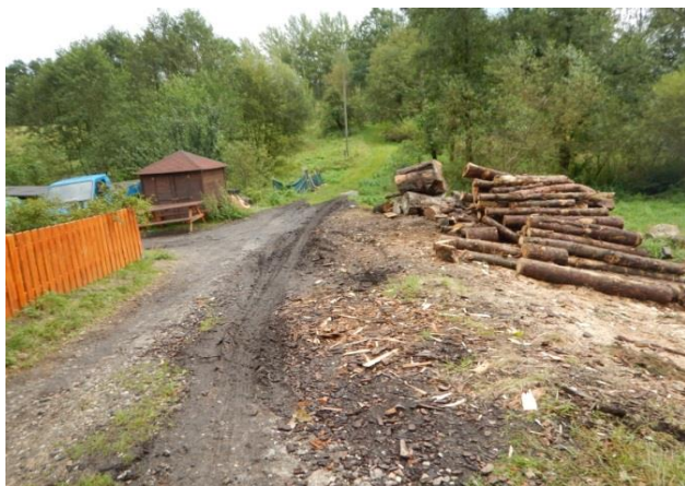
Lokalita kritického bodu - propustek pod místní cestou

Na tomto toku jsou rovněž problémy s urychleným odtokem způsobeným řešením odvodnění u kruhového objezdu.