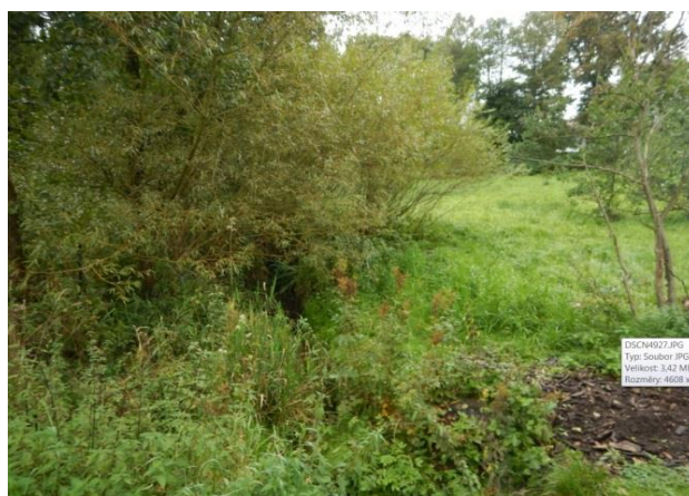
Zarostlé koryto nad propustkem